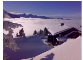
Blick vom Tegelberghaus