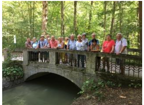
9 Bäche Wandertour